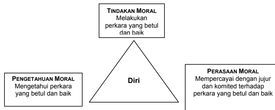
Rajah 1: Hubungan antara pengetahuan moral, perasaan moral dan tindakan moral

konsisten. Implikasinya, murid perlu disediakan dengan peluang yang banyak dan pelbagai bagi mengamalkan nilai murni. Kemahiran yang relevan untuk tindakan moral termasuk