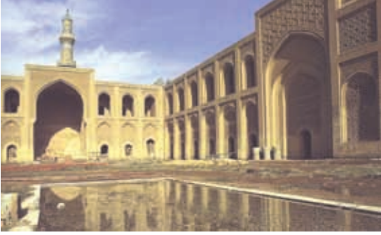
المدرسة المستنصرية - بغداد-

أ. المدرسة النظامية: شيدها الوزير السلجوقي نظام الملك، في الجانب الشرقي من بغداد.