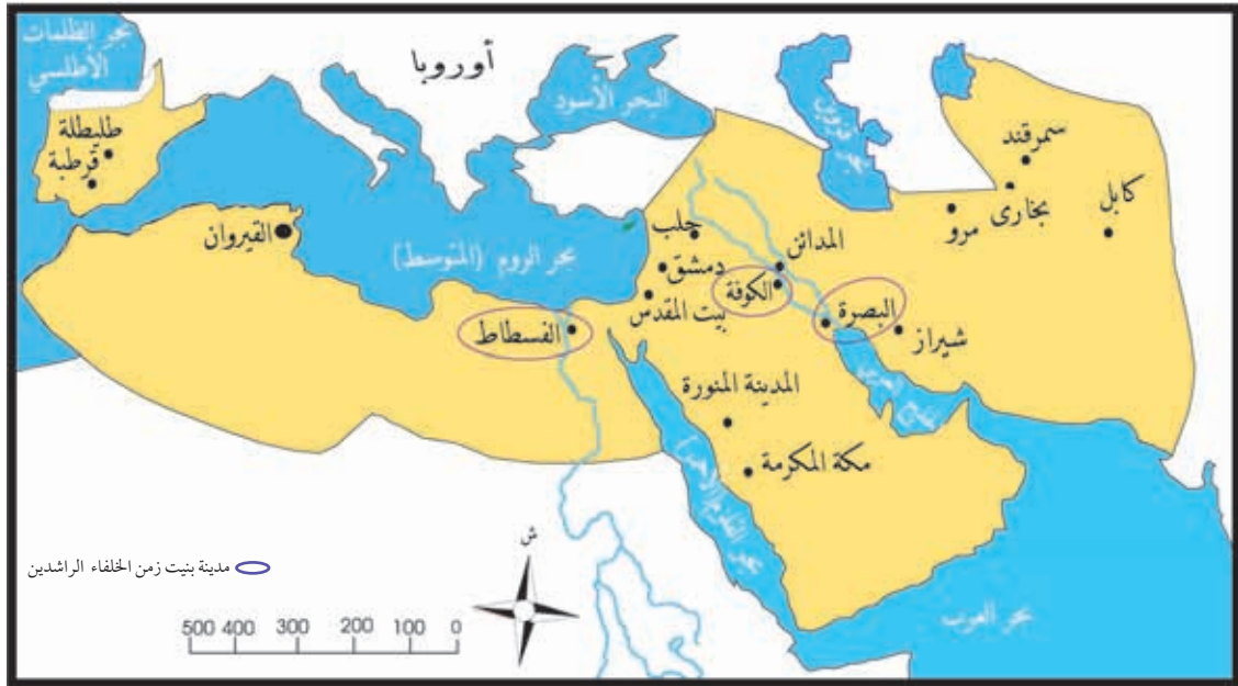
خريطة المدن الاسلامية

نتأمل الخريطة الآتية، ونفكر في الإجابة عن الأسئلة التي تليها: