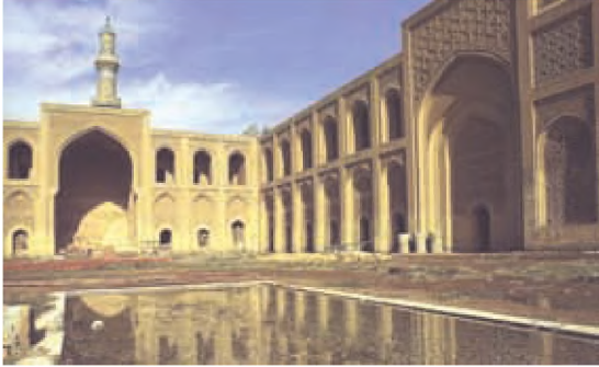
المدرسة المستنصرية - بغداد-

أ. المدرسة النظامية: شيدها الوزير السلجوقي نظام الملك، في الجانب الشرقي من بغداد.