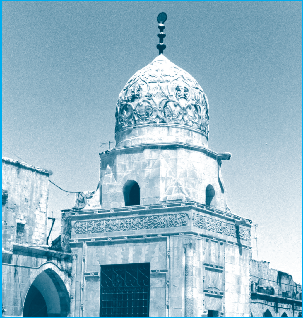
سبيل قايتباي في القدس الشريف