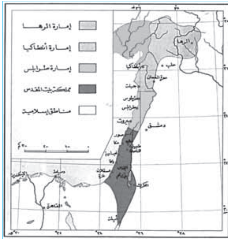
الإمارات الفرنجية في بلاد الشام

تأمل الخريطة الآتية، ونفكر في الإجابة عن الأسئلة التي تليها: