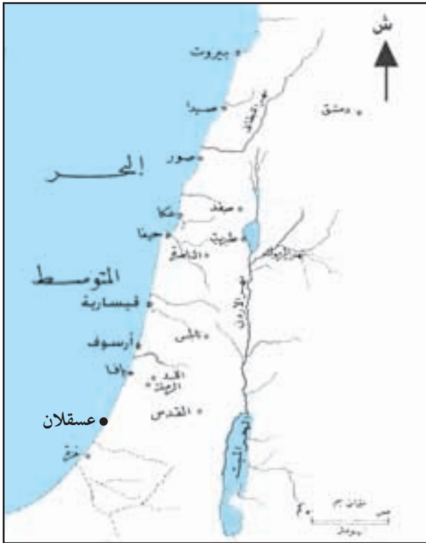
خريطة صلح الرملة