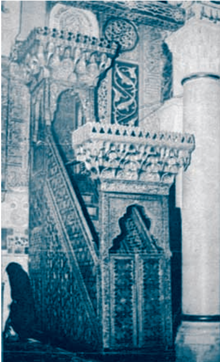
منبر المسجد الأقصى

بدأ القتال بمناوشات بين الطرفين، وحاولت قوة من فرسان الفرنج الخروج لقتال المسلمين، فأجبرتها القوات الإسلامية على الانسحاب داخل المدينة المقدسة. وتمكن المسلمون من الوصول إلى السور، ونقبوه، والمجانيق توالي الرمي لتبعد الفرنج عن السور. وعندما رأى الفرنج أنهم منهزمون طلبوا الأمان، وتسليم بيت المقدس إلى صلاح الدين، فوافق على ذلك بعد استشارة أصحابه. وتسلم المدينة المقدسة في ٢٧ رجب ٥٨٣ هـ / ٢ تشرين الأول ١١٨٧ م، في ذكرى الإسراء والمعراج، وانطلقت صيحات المسلمين بالتهليل والتكبير، والحمد لله على نصره، ورفعت الأعلام الإسلامية على أسوارها.