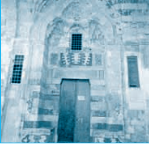
مدخل المدرسة الأشرفية في القدس الشريف

ازدهرت الحركة العلمية زمن المماليك، وأسهمت المرأة فيها، وكانت مصر ميداناً لنشاط علمي واسع، وقد شجع بعض سلاطين المماليك العلم والعلماء، مثل الظاهر بيبرس، وخلف عصر المماليك ثروة علمية ضخمة تمثلت في المخطوطات الموزعة في العالم، ووجدت مؤسسات تعليمية كثيرة من مدارس ومساجد وغيرها، وكانت مواد التدريس علوم القرآن، والفقه، والحديث، واللغة العربية، والحساب، والتاريخ، والطب، والفلك، والهندسة، والكيمياء.