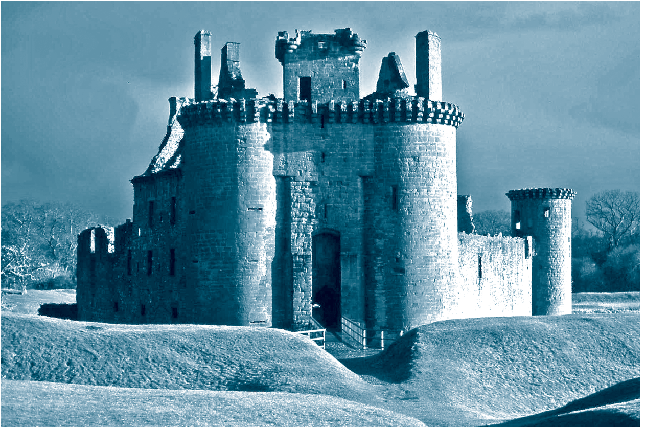
قلعة الامير في العصور الوسطى