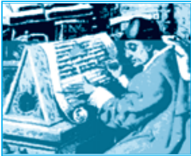
راهب ينسخ مخطوطة

لعبت الكنيسة دوراً مهماً في حياة الناس في العصور الوسطى، وتولت مهام عديدة كالإشراف