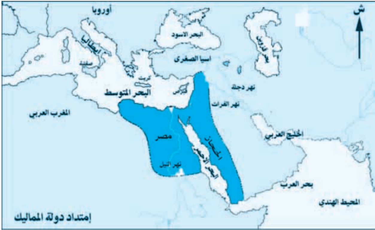
خريطة دولة المماليك

مرت الدولة المملوكية منذ نشأتها، وحتى نهايتها، على يد العثمانيين بعد معركتي مرج دابق سنة ٩٢٢هـ/١٥١٦م في شمال سوريا، والريدانية سنة ٩٢٣هـ/١٥١٧م في مصر بالأدوار الآتية .