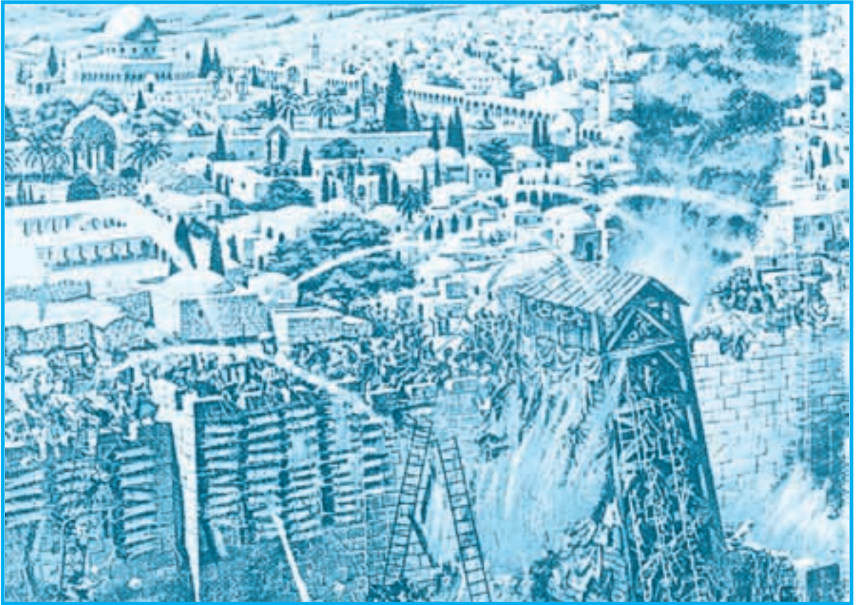
حصار الفرنجة للقدس الشريف