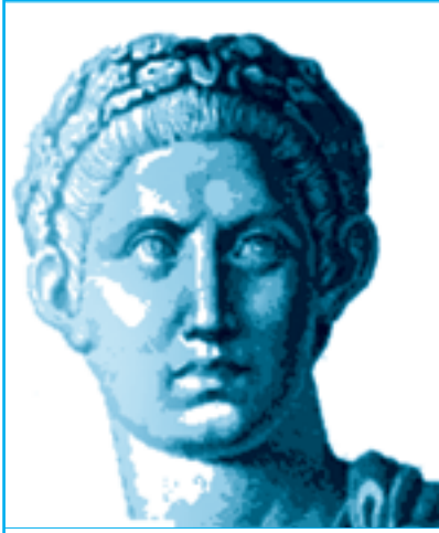
الإمبراطور قسطنطين الكبير: إمبراطور روماني تولى العرش عام ٣٠٥م اعترف بالمسيحية ديانة رسمية في الدولة، وهو مؤسس مدينة القسطنطينية عام ٣٣٠م.