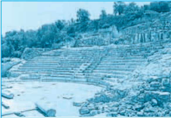
المدرج الروماني في سبسطية

ج- العقلانية: مجدت الفكر الإنساني، وأمنت بقدرة الإنسان وقابليته على تحدي الطبيعة باستخدام العقل والمنطق.