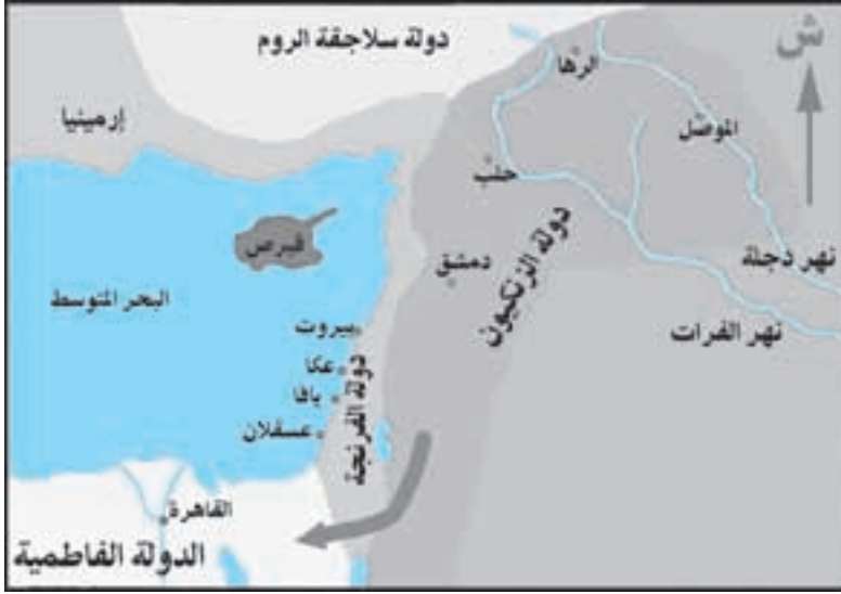
فتح الرّها والسيطرة على مصر

تولى نور الدين زنكي الحكم بعد وفاة والده عام ٥٤١هـ / ١١٤٦م، واتخذ من حلب عاصمة له، وأدرك أن الوحدة الجزئية التي حققها والده عماد الدين زنكي بين شمال العراق وشمال الشام لا تكفي لتحقيق آمال المسلمين في طرد الفرنج من الشام، فعمل على ضم دمشق إلى ملكه عام ٥٤٩هـ / ١١٥٤م، وأيقن نور الدين