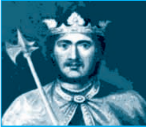
ريتشارد قلب الأسد

١- الحملة الأولى من ١٠٩٥ - ١٠٩٩ م : وتمكنت من تأسيس مملكة بيت المقدس ، وثلاث إمارات أخرى هي الرُّها ، وأنطاكية ، وطرابلس .