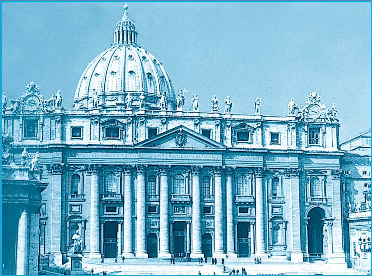
كنيسة القديس بطرس في روما

نتأمل الصورة الآتية، ونفكر في الإجابة عن الأسئلة التي تليها: