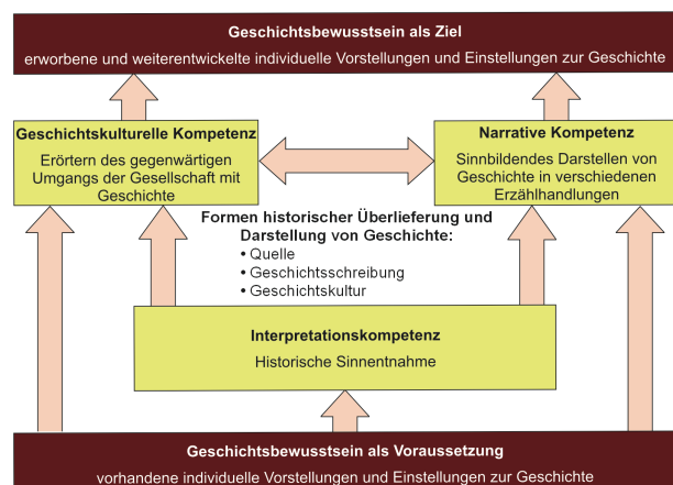
Abbildung 2: Kompetenzmodell Fachlehrplan Geschichte Gymnasium 2

Übergreifend und immanent zu diesen gemeinsamen Kompetenzbereichen sind drei Aspekte für Schülerinnen und Schüler wichtig, die sich auf den gymnasialen Bildungsgang vorbereiten: