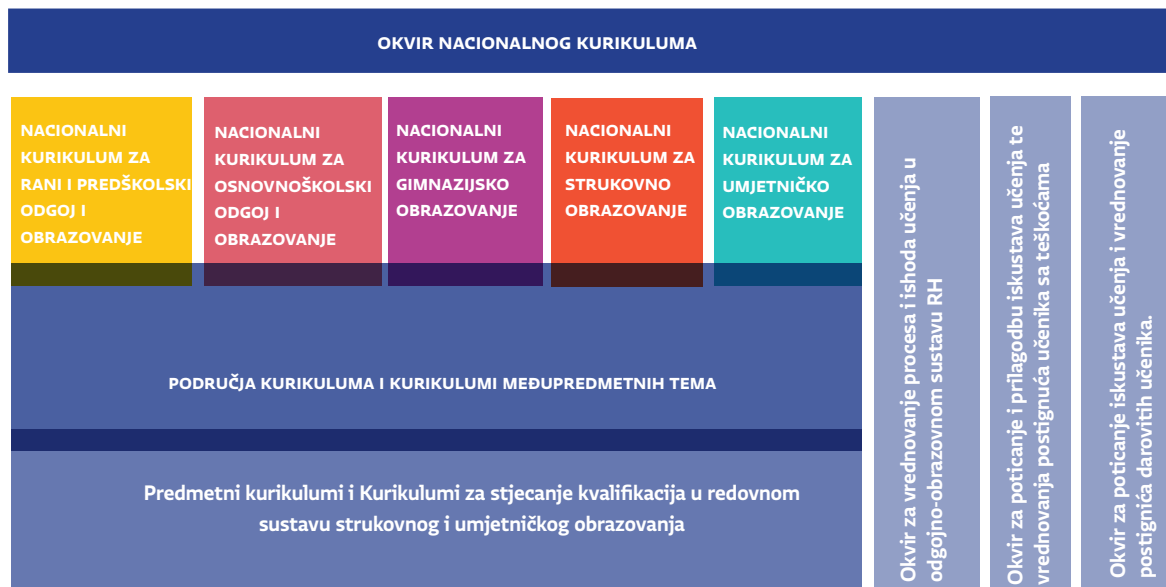
Slika A. Sustav nacionalnih kurikulumskih dokumenata izrađenih u okviru Cjelovite kurikularne reforme

Pred Vama se nalazi prijedlog nacionalnog kurikuluma nastavnog predmeta . Nacionalni kurikulum nastavnih predmeta dio su sustava nacionalnih kurikulumskih dokumenata koji je Okvirom nacionalnog kurikuluma (ONK) određen kao sustav dokumenata kojima se na nacionalnoj razini iskazuju namjere povezane sa svrhom, ciljevima, očekivanjima, ishodima, iskustvima djece i mladih osoba, s organizacijom odgojno-obrazovnog procesa i s vrednovanjem. Sustav nacionalnih kurikulumskih dokumenata prikazan je na Slici A.