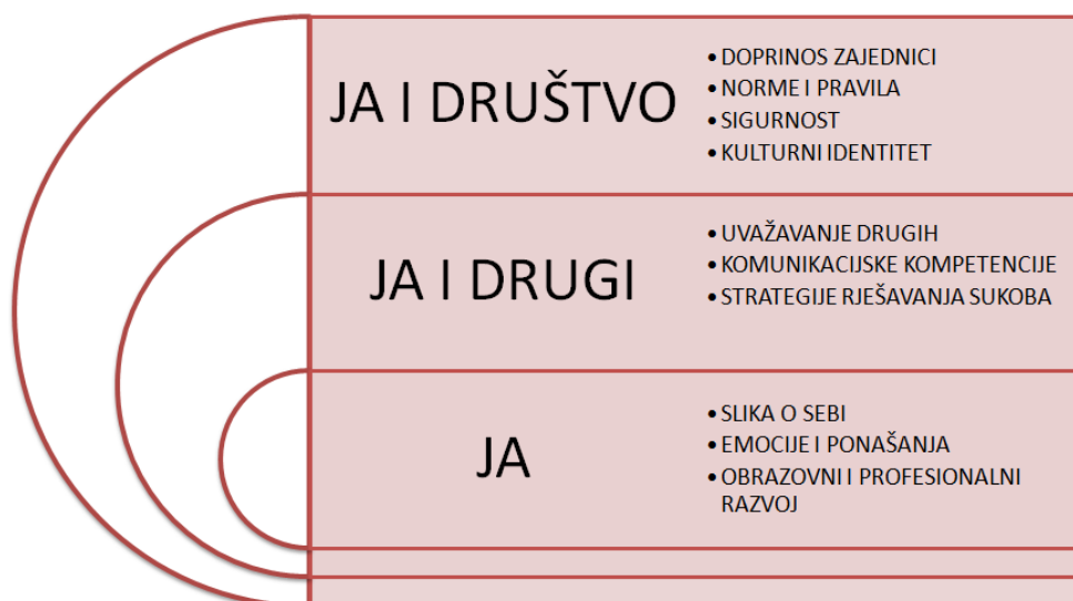
Slika 2. Grafički prikaz domena u međupredmetnoj temi Osobni i socijalni razvoj