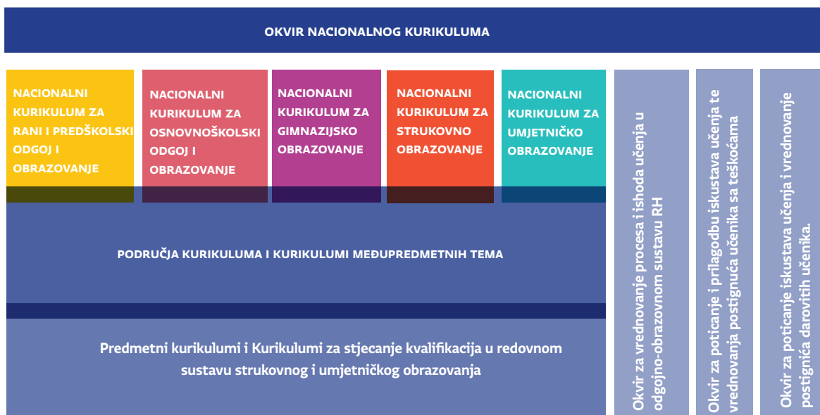
Slika A. Sustav nacionalnih kurikulumskih dokumenata izrađenih u okviru Cjelovite kurikularne reforme

Pred Vama se nalazi prijedlog nacionalnog kurikuluma međupredmetne teme Učiti kako učiti . Okvir nacionalnog kurikuluma (ONK) određuje sustav nacionalnih kurikulumskih dokumenata , kojima se na nacionalnoj razini iskazuju namjere povezane sa svrhom, ciljevima, očekivanjima, ishodima, iskustvima djece i mladih osoba, s organizacijom odgojno-obrazovnog procesa i s vrednovanjem. Međupredmetne teme izrazito su važan dio odgoja i obrazovanja u Republici Hrvatskoj. Sustav nacionalnih kurikulumskih dokumenata prikazan je na Slici A.