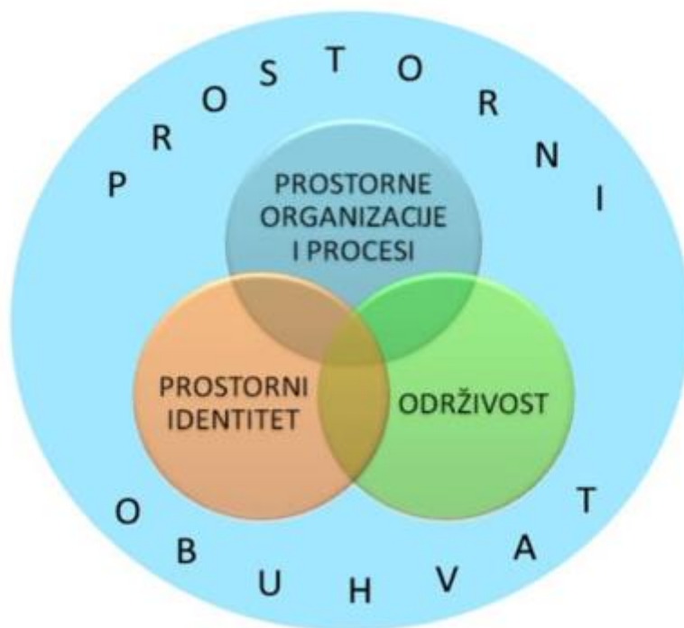
1. slika Koncepti u Geografiji