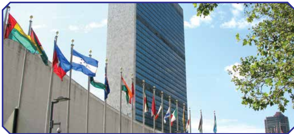
BMT shtab kvartirasi. Nyu-York

O'zbekiston BMT a'ziligiga 1992-yil 2-martda qabul qilindi. BMT bosh idorasi Nyu-Yorkda (AQSh) joylashgan.