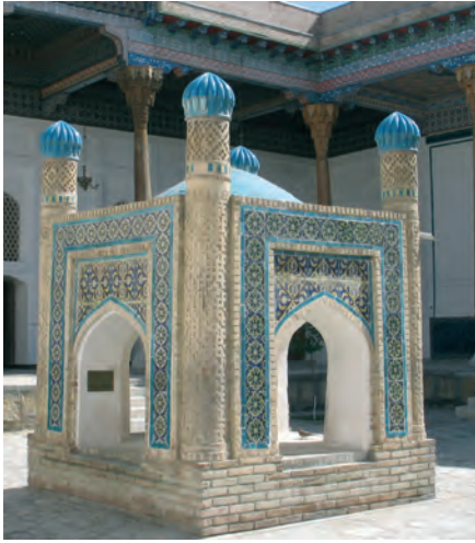
Buxoro. Bahouddin Naqshband maqbarasi

Agar chuqurroq o‘ylab ko‘radigan bo‘lsak, Yer yuzidagi jonli va jonsiz narsalarning barchasi doimiy harakatda. Bu harakatlarning hammasi aniq maqsadga qaratilgan. Dunyoda maqsadsiz yaratilgan, ortiqcha bo‘lgan narsaning o‘zi yo‘q. Zamonaviy ilm-fan shuni tasdiqlamoqdaki, hatto eng mayda hasharotlar ham dunyoda qandaydir ekologik muvozanatni saqlab turadi. Agar ular yo‘qotilsa, olamdagi umumiy muvozanat buziladi. Ulug‘ bobomiz ana shu haqiqatni nazarda tutib, insonlarga qarata, sen ham Oллоhdan ibrat ol, erta-yu kech mehnatda bo‘l, harakatdan to‘xtama, demoqda.