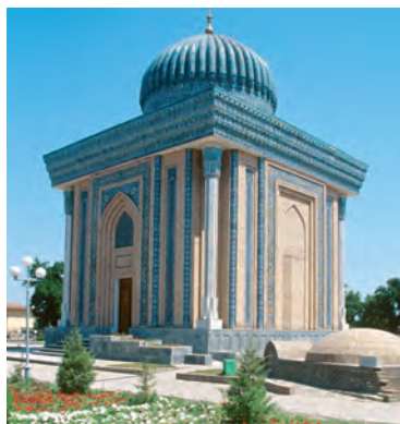
Samarqand. Imom Moturidiy maqbarasi

« Mafkura » arabcha so'z bo'lib, fikrlash degan ma'noni bildiradi.