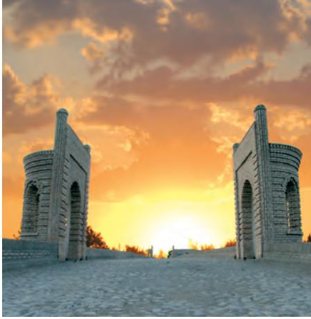
Qarshi. Qadimiy ko‘prik

ziyolilarimiz qatag‘on qilindi. Sho‘ro tuzumi davrida balandparvoz shiorlar ostida qilingan bunday noma‘qul ishlarni sanab adog‘iga yetish qiyin. O‘sha zamondagi qaysi bir kommunistik tadbirni olib qaramaylik, barchasining buzg‘unchilikdan iborat ekanini ko‘ramiz. Bularning hammasiga sabab bolshevizm g‘oyalarining vayronkor g‘oyalar bo‘lganidir.