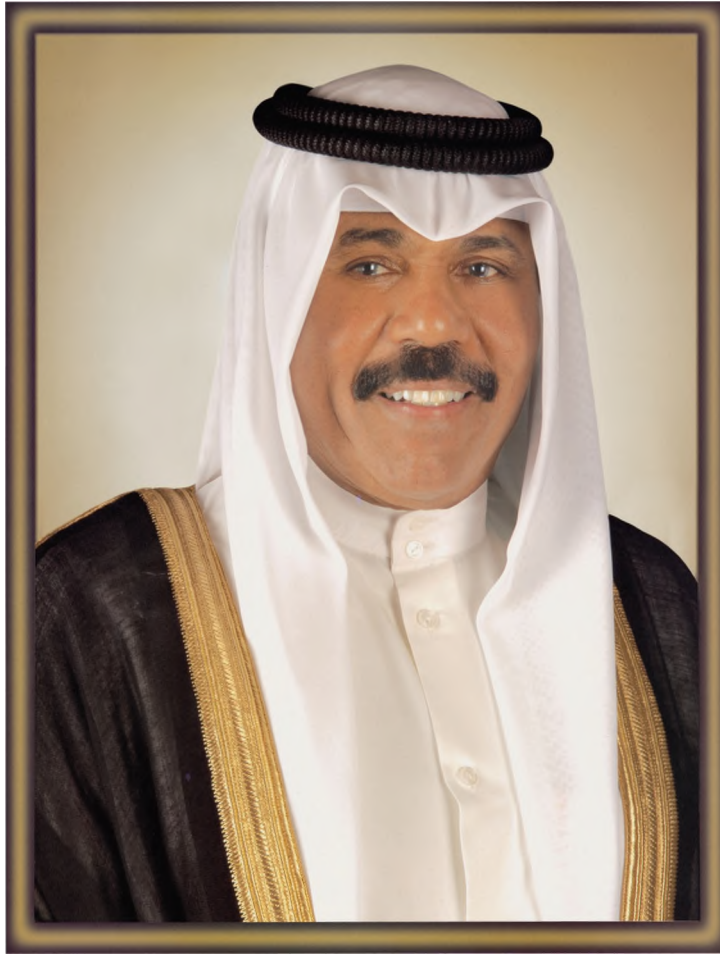
سَيِّدُ الشَّيْخِ نَوَافِ بْنِ أَحْمَدَ بْنِ جَابِرِ بْنِ الصَّبَّاحِ وَلِيِّ عَهْدِ دَوْلَةِ الْكُوَيْتِ