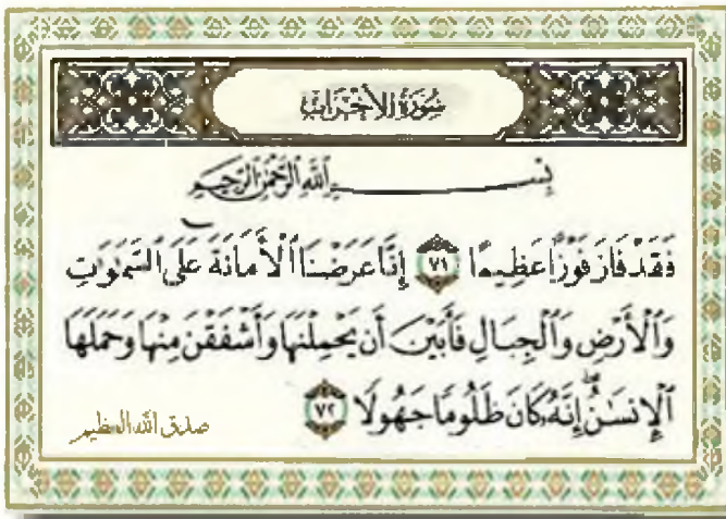
سورة الأجراب - الأيتين (٧١-٧٢)