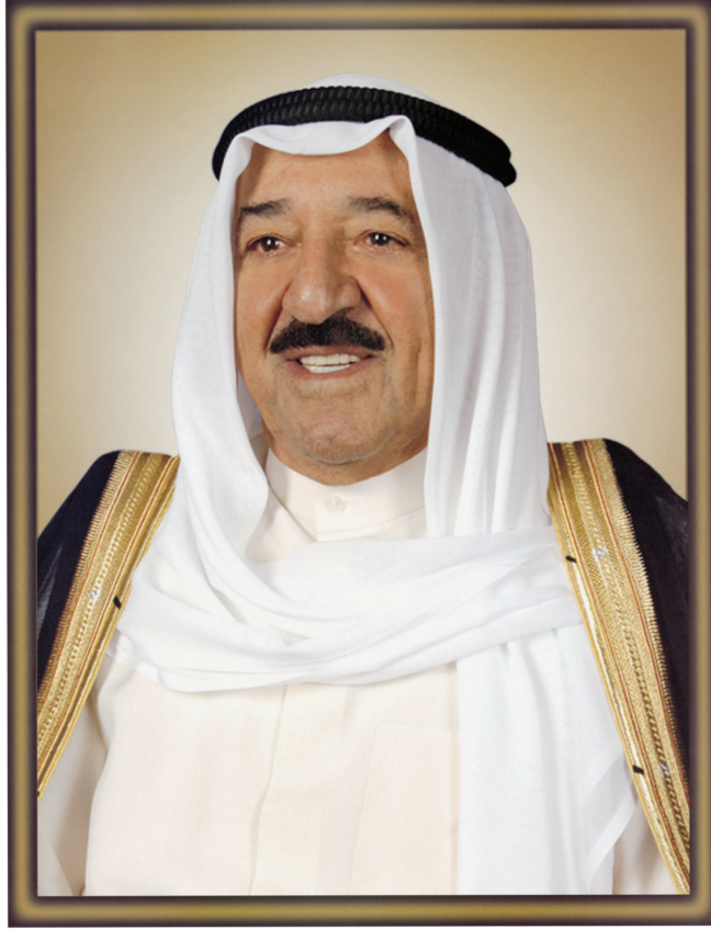
صاحب السمو الشيخ أحمد الجابر الصباح أمير دولة الكويت