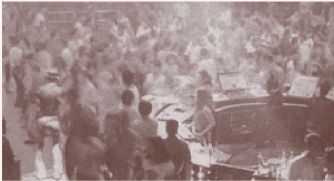
Media Indonesia Aktivitas para remaja di diskotik