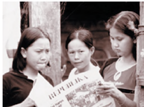
dok penulis Dengan media massa akan terjadi transformasi sosial budaya terhadap masyarakat