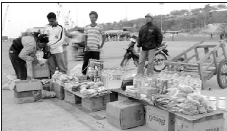
www.indonesia.com Kegiatan ekonomi yang dilakukan masyarakat

Kehidupan manusia tidak pernah lepas dari persoalan-persoalan ekonomi, karena manusia senantiasa berjuang untuk memenuhi kebutuhan hidupnya. Tujuan manusia melakukan tindakan-tindakan ekonomi adalah untuk memenuhi kebutuhan hidupnya dan mempertahankan hidupnya. Sejak zaman pra sejarah kehidupan manusia dalam memenuhi kebutuhannya sangat berpengaruh terhadap perkembangan sosial masyarakat itu sendiri. Sampai dengan sekarang jaman moderen corak kehidupan manusia ditentukan oleh corak kehidupan ekonominya. Contohnya Indonesia adalah negara agraris, maka corak kehidupan manusia pun akan dipengaruhi oleh budaya-budaya masyarakat agraris.