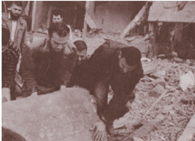
Kehancuran dan korban akibat peperangan menggambarkan betapa nyawa tidak ada harganya

Berbagai pelanggaran HAM dewasa ini nampak dekat di depan mata. Pembunuhan yang terjadi dalam setiap konflik sosial/ budaya seperti tawuran, perkelahian antar kampung/suku, ataupun pembunuhan yang terjadi dalam konflik politik/militer yaitu peperangan. Nyawa manusia seakan-akan tidak ada harganya. Pembunuhan hanyalah merupakan satu contoh di antara sekian perilaku penyimpangan.