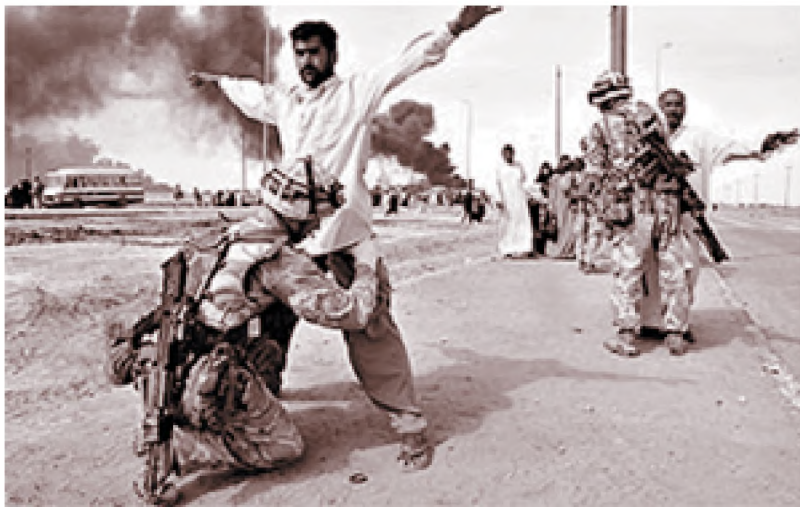
kompas Perang antara Irak dengan Amerika belakangan ini telah menghancurkan sistem tata masyarakat di Irak.

Hancurnya nilai sosial juga akan mengakibatkan hancurnya sistem sosial di masyarakat. Akibat terjadi penyimpangan-penyimpangan sosial dan masalah-masalah sosial. Contohnya, proses adaptasi nilai westernisasi yang tidak sesuai dengan nilai yang sebelumnya dianut oleh masyarakat Indonesia seperti pergaulan bebas yang banyak menimbulkan perilaku-perilaku yang tidak sesuai dengan nilai sosial masyarakat Indonesia.