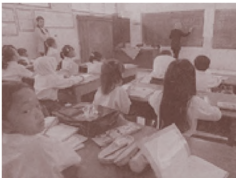
Kompas Sekolah juga memiliki andil besar dalam proses sosialisasi anak

Media massa merupakan salah satu unsur teknologi yang memiliki peranan sebagai media sosialisasi. Melalui media akan terjadi transformasi sosial dan budaya terhadap masyarakat luas. Alat komunikasi ini memiliki fungsi untuk menyampaikan pesan tanpa terikat oleh nilai dan norma yang ada di masyarakat.