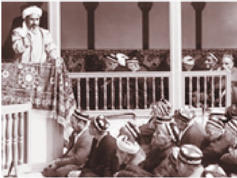
Seorang Kiayi merupakan sosok yang mampu memberi motivasi pada publik

kian rupa, sehingga orang yang diberi motivasi tersebut menuruti atau melaksanakan apa yang dimotivasi secara kritis, rasional dan penuh tanggung jawab.