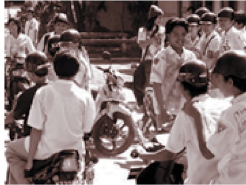
www.kutikartane- Aksi corat-coret yang dilakukan para siswa merupakan suatu bentuk penyimpangan

Contohnya adalah pemakai dan pengedar narkoba, penjudi, pemabuk dan penjahat.