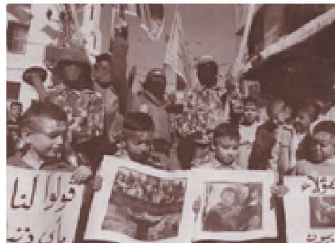
Reaksi masyarakat Palestina terhadap penyerangan Israel kompas