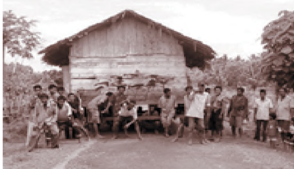
gotong royong merupakan ciri khas dari kebudayaan kompos bangsa indonesia

Nilai sosial merupakan gambaran dan ciri masyarakat tersebut, karena nilai itu adalah data yang diambil dari pengalaman masyarakat sepanjang sejarah masyarakat tersebut. Sebagai contoh nilai gotong royong dan nilai musyawarah yang dimiliki oleh masyarakat Indonesia. Nilai gotong royong dan nilai musyawarah itu menjadi identitas bangsa Indonesia.