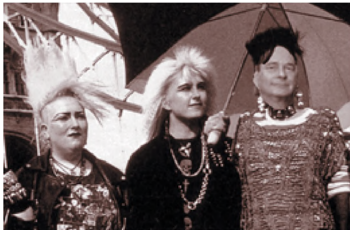
Anak-anak funk, merupakan salah satu gaya remaja masa kini

Dengan demikian tindakan dapat dikatakan sebagai gaya seperti kelompok atau person idealnya, yang ditiru bisa sebagian tindakannya bisa juga berusaha meniru seluruhnya, seperti cara berpakaian, cara berbicara, cara berindak bahkan gaya berjalan atau bertingkah laku. Imitasi memiliki segi negatif bagi pelakunya, yaitu daya kreasinya dapat tidak berkembang karena hanya ingin meniru orang lain. Segi positifnya ialah apabila yang ditiru adalah sikap dan perilaku yang sesuai dengan norma.