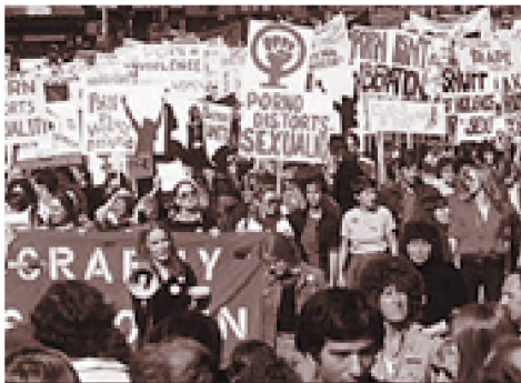
Reaksi Masyarakat yang menolak Pornografi kompas

Suatu ilmu sekurang-kurangnya dapat dirumuskan dalam dua cara, yaitu: