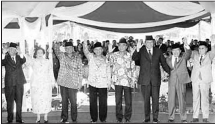
www.indonesia.com Kampanye di Indonesia