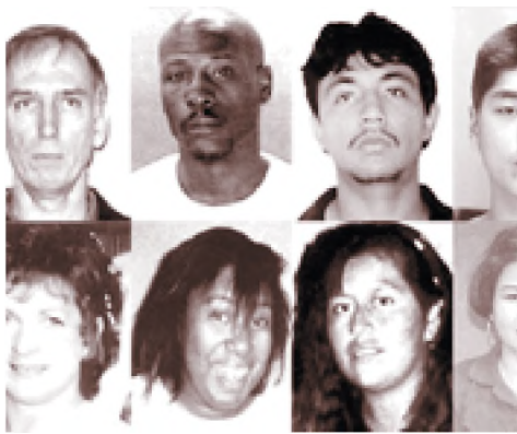
www.id.wikipedia.org Jenis Ras Manusia

membantu menjelaskan beberapa persamaan dalam kepribadian dan perilaku semua orang. Setiap warisan biologis seseorang juga bersifat unik, yang berarti bahwa tidak seorang pun yang mempunyai karakter fisik yang sama. Sebagian masyarakat menilai bahwa kepribadian seseorang tidak lebih dari penampilan warisan biologisnya. Karakteristik kepribadian seperti ketekunan, ambisi, kejujuran, kriminalitas dan kelainan seksual dianggap timbul dari kecenderungan-kecenderungan turunan. Contoh lainnya dapat dilihat dari IQ yang dimiliki oleh seorang anak akan mirip dengan IQ yang dimiliki oleh orang tua kandungnya. Faktor keturunan berpengaruh kuat terhadap keramahan perilaku kompulsif