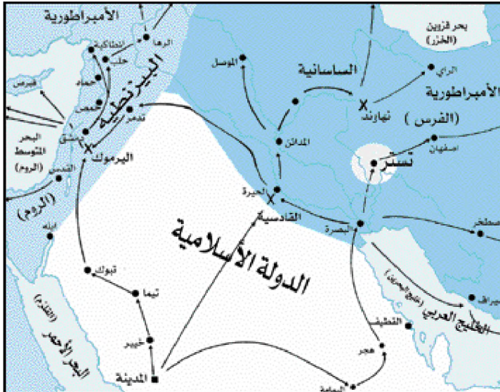
موقعة تستر (الفتوحات الإسلامية)

استمرت دعوة الإسلام في الانتشار حتى بلغت أيام عمر بن الخطاب إلى مشارف فارس، ففي سنة عشرين للهجرة توجه جيش المسلمين إلى فتح (تُستَر) وكانت