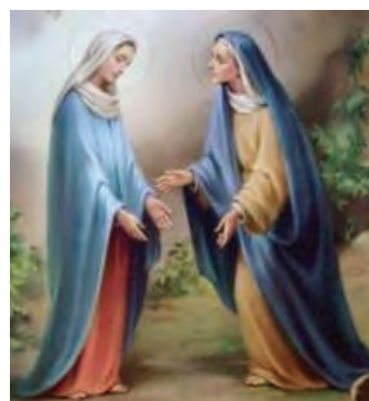
Gbr 2.8 Maria dan Elisabet

Pada suatu kali, waktu tiba giliran rombongan, Zakharia melakukan tugas keimaman di hadapan Tuhan. Sebab ketika diundi, sebagaimana lazimnya, untuk