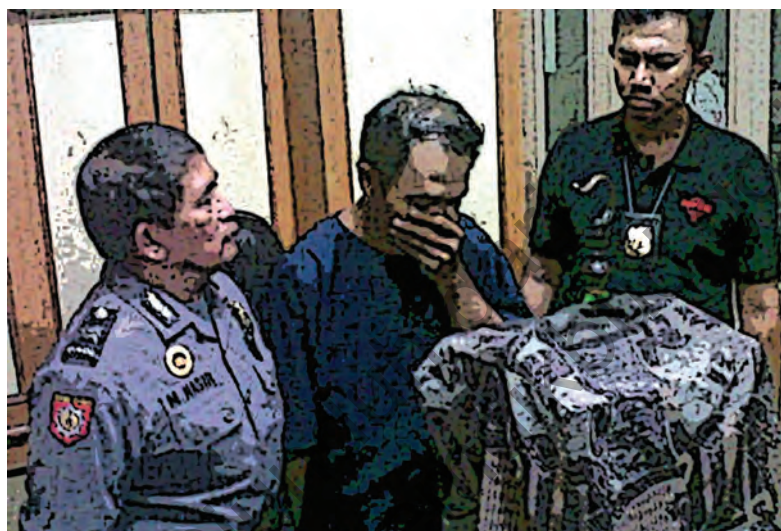
Gbr. 2.11 orang yang diselamatkan polisi dari amuk massa