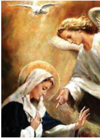
Gbr. 2.9 Maria dan malaikat

Kata Maria kepada malaikat itu: “Bagaimana hal itu mungkin terjadi, karena aku belum bersuami?” Jawab malaikat itu kepadanya: “Roh Kudus akan turun atasmu dan kuasa Allah Yang Mahatinggi akan menaungi engkau; sebab itu anak yang akan kaulahirkan itu akan disebut kudus, Anak Allah. Dan sesungguhnya, Elisabet, sanakmu itu, ia pun sedang mengandung seorang anak laki-laki pada hari tuanya dan inilah bulan yang keenam bagi dia, yang disebut mandul itu. Sebab bagi Allah tidak ada yang mustahil.”