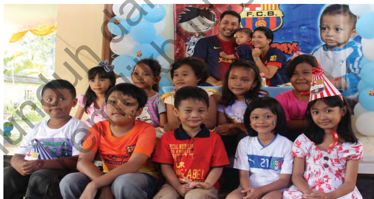
Gbr. 1.4 anak laki-laki dan perempuan

Setelah mengamati gambar-gambar di atas, jawablah pertanyaan-pertanyaan di bawah ini!