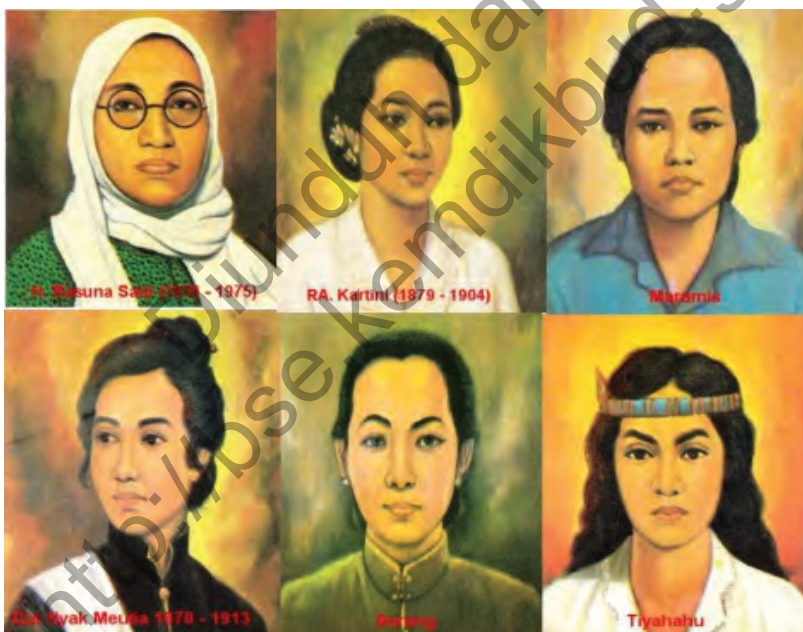
Gbr. 2.6 Tokoh-tokoh Perempuan Indonesia

Perhatikanlah gambar tokoh-tokoh perempuan Indonesia di bawah ini!