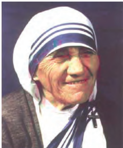
Gbr. 2.5 Bunda Theresa

Baca dan simaklah cerita Ibu Theresa dari Kalkuta India, berikut ini!