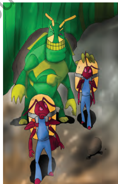
Gbr. 2.2 Semut bekerja keras, sementara belalang malas-malasan

Tidak lama kemudian musim dingin pun tiba. Udara dingin terasa menusuk tulang. Dimana-mana turun salju menutupi jalanan, pepohonan dan rerumputan. Belalang tersiksa karena kemana pun ia pergi tidak ada makanan yang tersedia. Dengan terpaksa ia pun mendatangi semut sambil memohon: “Hai semut, sahabatku. Berilah aku sedikit makananmu, karena aku sangat kelaparan”. Tetapi semut menjawab: “Maaf, persediaan makananku harus cukup sampai musim dingin berakhir”. Belalang pun agak memaksa: