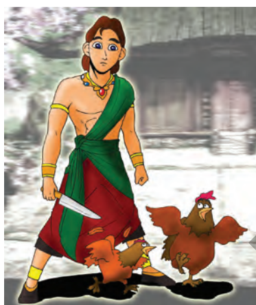
Gbr. 2.1 Pangeran Bungsu

Raja Suta Permana adalah pemimpin bagi rakyat di wilayah Jati Mandala. Ia sangat disayangi rakyatnya, dan disegani kerajaan-kerajaan di sekitarnya. Puluhan tahun, Raja Suta Permana telah memimpin Jati Mandala dengan bijaksana. Rakyat hidup sejahtera dan saling menghormati.