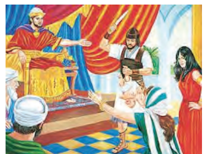
Gbr. 2.4 Raja Salomo yang bijaksana menyelesaikan perkara.

Tak lama kemudian datanglah dua orang perempuan menghadap raja Salomo. Yang pertama berkata kepadanya: "Ya Tuanku, aku dan perempuan ini tinggal bersama dalam satu rumah dan aku melahirkan anak, pada waktu ia di rumah itu. Tiga hari kemudian, perempuan ini pun melahirkan anak. Kami sendirian. Tidak ada orang bersama-sama kami di dalam rumah. Pada waktu malam, anak perempuan ini mati, karena tertindih waktu perempuan ini tidur. Di tengah malam ia bangun, diambilnya anakku dari sisiku dan anakku digantinya dengan anaknya yang sudah meninggal. Tadi