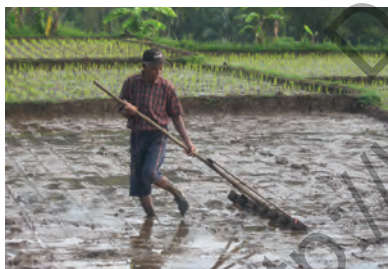
Gbr. 1.6 Bapak Petani