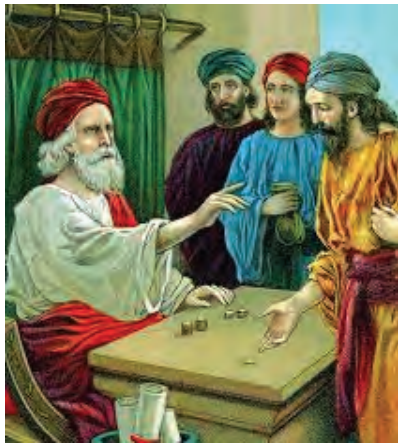
Gbr. 5 Seorang tuan menitipkan uang talenta

Sesudah itu datanglah hamba kedua yang menerima dua talenta. Ia berkata kepada tuan itu: “Tuan, ini uang dua talenta yang Tuan percayakan kepada saya; lihat aku telah beroleh laba dua talenta.” Kata tuannya: “Baik sekali perbuatanmu itu, hai hambaku yang baik dan setia; engkau telah setia memikul tanggung jawab dalam perkara kecil, aku akan memberikan kepadamu tanggung jawab dalam perkara yang besar. Masuklah dan turutlah dalam kebahagiaan tuanmu.”