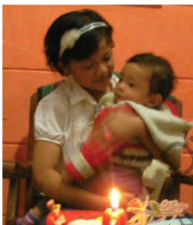
Gbr. 1.3 Anak yang masih kecil dan anak yang lebih besar

Untuk mengetahui dan memahami arti perkembangan, marilah kita memperhatikan gambar di bawah ini!