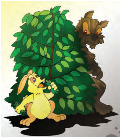
Gbr. 2.10 Kelinci dibalik pohon kopi

Pada suatu pagi, seekor anak kelinci yang lucu sedang menikmati wortel di kebun pinggir hutan. Karena lapar, kelinci itu makan dengan lahap. Ia tidak menyadari bahwa ada seekor serigala yang mengendap-endap, hendak memangsanya.