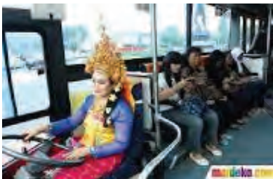
Gbr. 1.10 Perempuan mengemudi