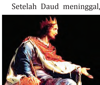
Gbr. 2.3 Raja Salomo

Setelah Daud meninggal, anaknya, Salomo, menduduki takhta kerajaan Israel. Ia mengasihi dan setia kepada Tuhan dan menuruti nasihat-nasihat ayahnya. Pada suatu malam, di Gibeon Tuhan menampakkan diri kepadanya dalam mimpi. Sabda Tuhan kepadanya: "Mintalah apa yang engkau kehendaki!" Jawab Salomo: "Ya Tuhan, Engkau telah menjadikan hamba-Mu ini raja. Aku masih muda dan tidak tahu seluk-beluk perkara. Lagi pula rakyat-Mu banyak sekali jumlahnya. Maka karuniakanlah hamba-Mu ini hati yang bijaksana supaya dapat memerintah umat-Mu!" Tuhan bersabda kepadanya: "Oleh karena engkau meminta hati yang bijaksana dan tidak menghendaki kekayaan dan umur panjang, maka akan Kuberikan kepadamu kebijaksanaan seperti belum pernah ada sebelum engkau atau sesudah engkau. Tambahan pula, Kuberikan kepadamu umur yang panjang!"