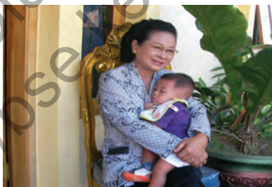
Gbr. 1.7 Ibu menggendong bayi