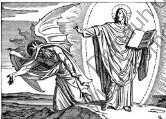
Gbr. 2.10 Yesus dan Iblis

Pada usia tiga puluh tahun, Yesus mulai menampakkan diri di depan umum. Selama itu, Yesus tinggal di Nazaret bersama ibu dan ayahnya, Maria dan Yosef. Setiap hari Yesus bekerja bersama Yosef sebagai tukang kayu.