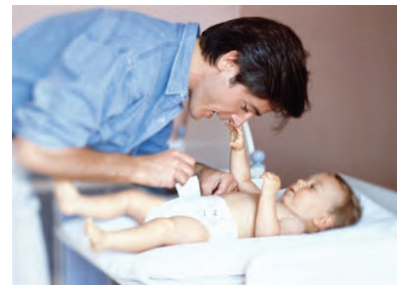
Gbr. 1.11 Seorang bapak memakaikan popok