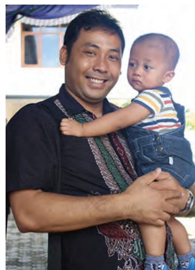
Gbr. 1.2 Seorang bapak menggendong putranya

Dalam hal ini, kita menyadari bahwa laki-laki dan perempuan memiliki perbedaan yang kodrati, yaitu perbedaan yang tidak bisa diubah. Misalnya, laki-laki tidak mungkin mengandung dan melahirkan anak.