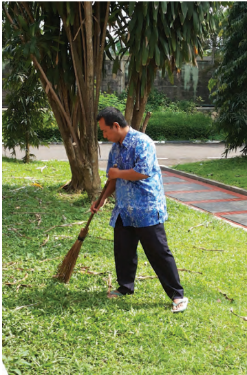
Gbr. 1.9 Seorang bapak menyapu halaman