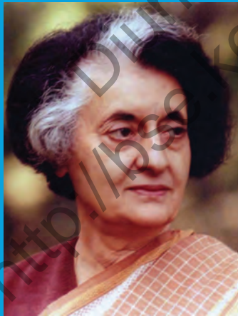
Indira Gandhi, Perdana menteri India

Amati foto-foto berikut! Tuliskan kesederajatan dalam hal apa yang tampak dalam gambar tersebut! Bagaimana pendapatmu tentang kesederajatan berikut?