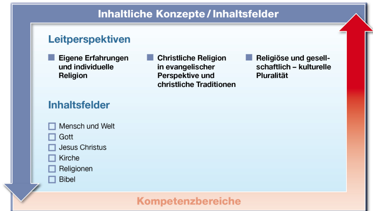
Abb. 2: Leitperspektiven und Inhaltsfelder

Für das Fach Evangelische Religion sind drei Leitperspektiven grundlegend, die abbilden, wie uns Religion in der Lebenswirklichkeit begegnet: „Eigene Erfahrungen und individuelle Religion“ – „Christliche Religion in evangelischer Perspektive und christliche Traditionen“ – „Religiöse und gesellschaftlich-kulturelle Pluralität“.