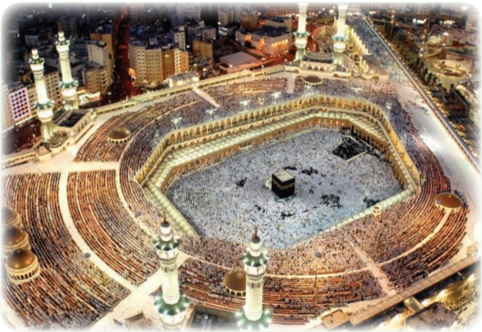
بيت الله الحرام