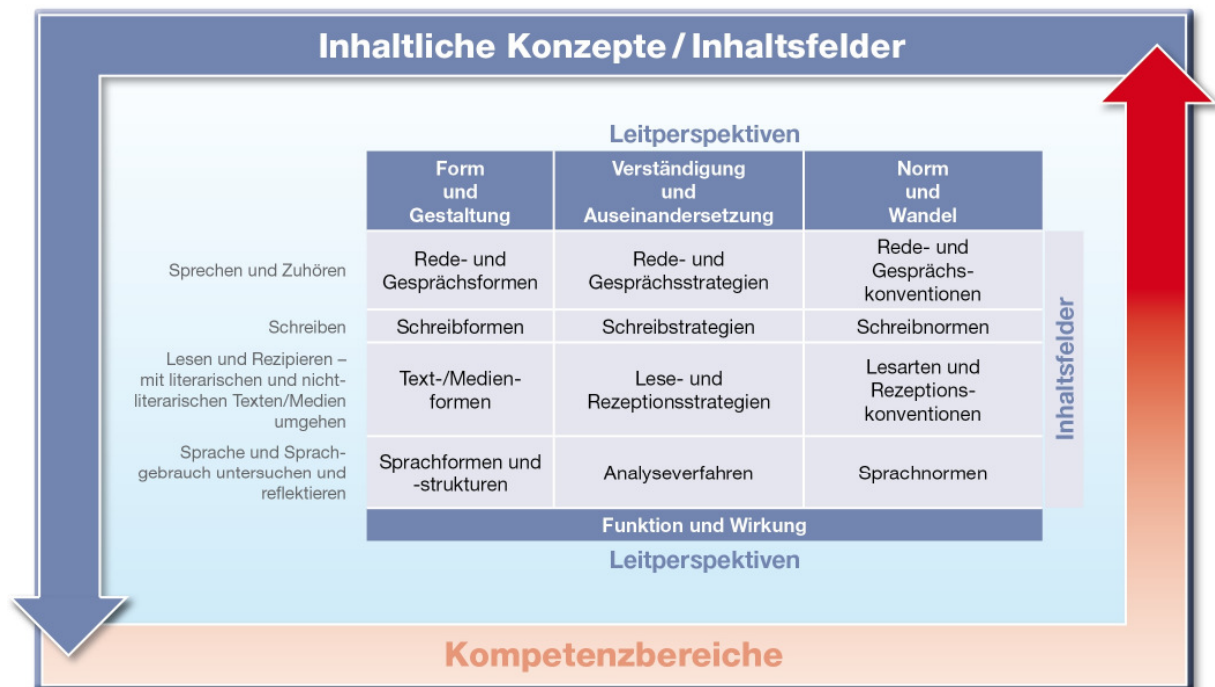
Abb. 2: Leitperspektiven und Inhaltsfelder