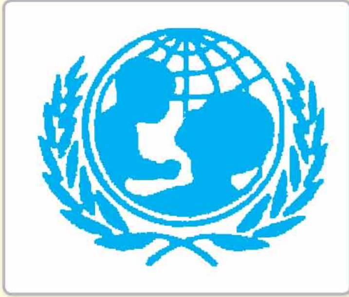
شعار منظمة اليونيسيف

كلمة (اليونيسيف) تتكون من الحروف الأولى لمنظمة الأمم المتحدة . وتنامت هذه الحركة مع تطور مفهوم حقوق الطفل وظهور مؤسسات تعبر عن هذه الحقوق .