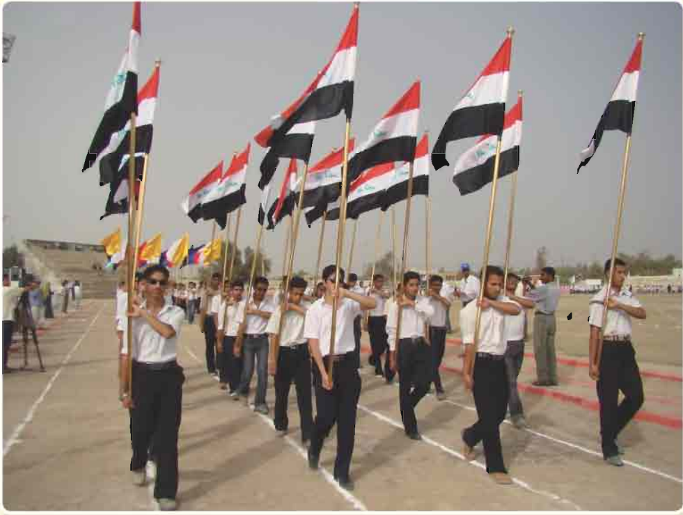
صورة لأحتفالية بعيد العمال

لذا جاءت توجهات دولة العراق نحو حق العمال في العيش بسعادة بعيداً عن الظلم والتمتع بحياة كريمة والتطلع الى مستقبل مضمون لعوائلهم وابنائهم ويتحقق ذلك من خلال التنسيق مع تلك التنظيمات بترسيخ مبادئ الديمقراطية في المجتمع .