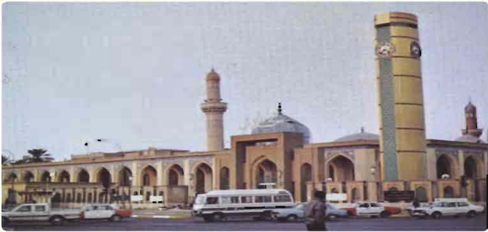
مرقد الامام الاعظم ابو حنيفة النعمان (رضي الله عنه)