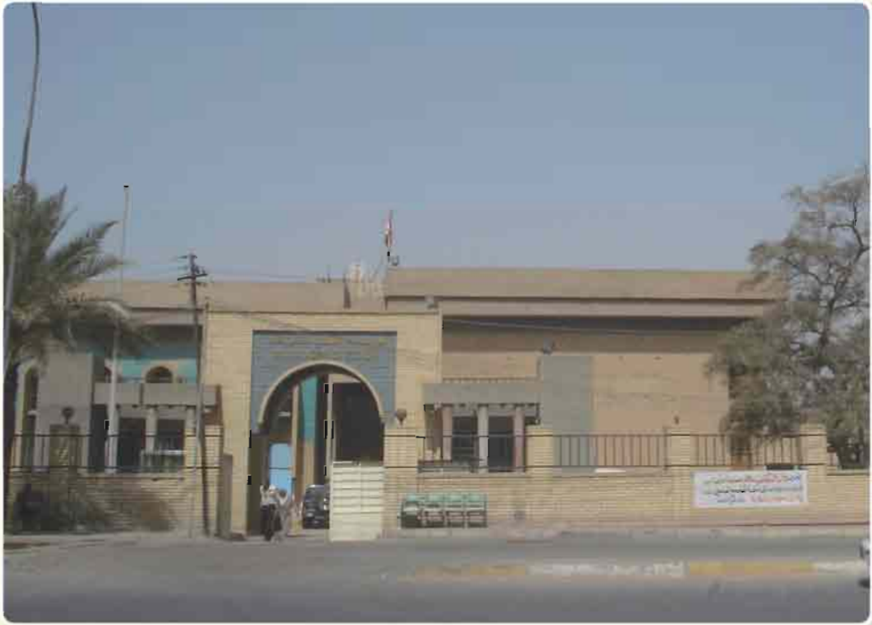
صورة لاحدى مؤسسات البحث العلمي (المجمع العلمي العراقي)

وضمن الدستور بأن تكفل الدولة للفرد والاسرة وبخاصة الطفل والمرأة الضمان الاجتماعي والصحي والمقومات الاساسية للعيش في حياة حرة كريمة يوفر فيها السكن والتربية والتعليم الجيد وتلتزم الدولة بتقديم الرعاية الصحية من وسائل الوقاية والعلاج وانشاء مختلف المؤسسات الصحية والتثقيفية ودور العناية بذوي الاحتياجات الخاصة، وترعى التفوق والابداع والابتكار لدى الافراد وتشجيع البحث العلمي للاغراض السلمية، وتؤكد على الرياضة التي تربي الفرد بدنياً و اخلاقياً.