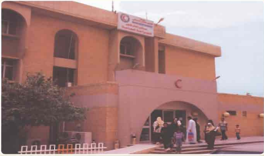
مستشفى الهلال الاحمر العراقي

اولاً : المنظمات الحكومية او الرسمية: تتولى الدولة فيها اقرار النظام الداخلي وطبيعة التمويل والاهداف التي تسعى الى تحقيقها وتكون إدارتها بالتعاون مع الهيئات والتنظيمات الرسمية ومن خلال الاعتماد على سياسة الدولة (الاجتماعية او الاقتصادية او السياسية) حيث تسعى الى النهوض بالمجتمع لتحقيق الضمان الاجتماعي والصحة والتعليم لجميع ابناء الشعب ومن هذه المنظمات (منظمة الهلال الأحمر العراقي ، اتحاد الصناعات العراقي ، المنظمة العراقية للتربية والثقافة والعلوم ، دور رعاية الايتام)