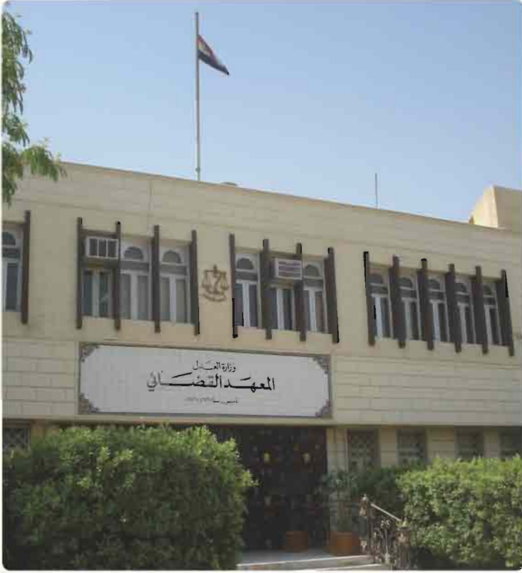
صورة لاحدى المؤسسات القضائية

تعدّ السلطة القضائية بموجب الدستور سلطة مستقلة إستقلالاً تاماً ولا يجوز لأي فرد أو جهة التدخل في القضاء أو شؤون العدالة. وتمثلها المحاكم على اختلاف أنواعها ودرجاتها، وتصدر احكامها وفقاً للقانون.