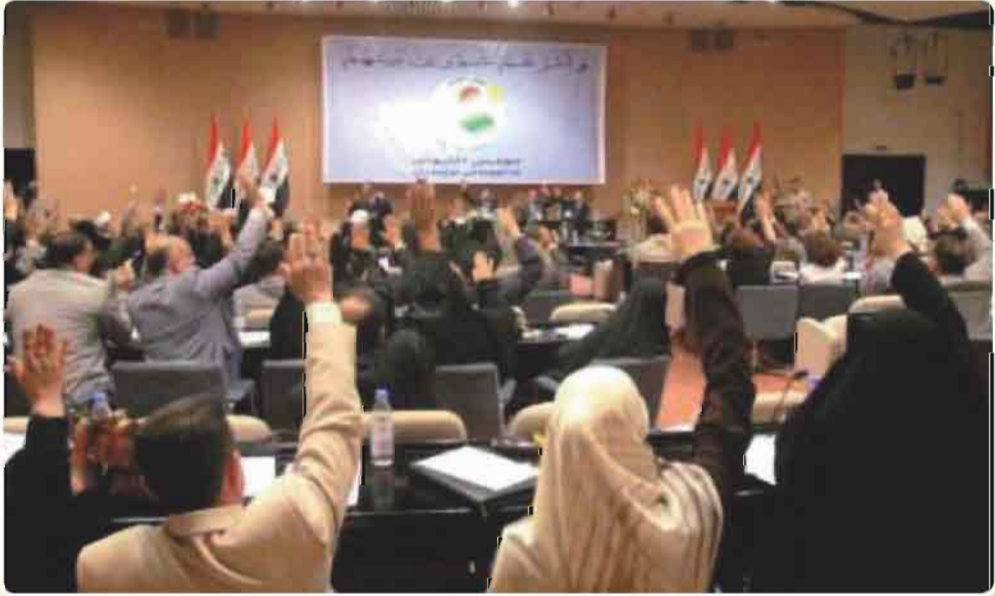
صورة لمجلس النواب العراقي (البرلمان)

ويختص مجلس النواب بتشريع القوانين والرقابة على اداء السلطة التنفيذية والمصادقة على المعاهدات والاتفاقيات الدولية وإقرار الموازنة العامة والموافقة على تعيين الاشخاص في المناصب العليا في الدولة وغيرها من المهام .