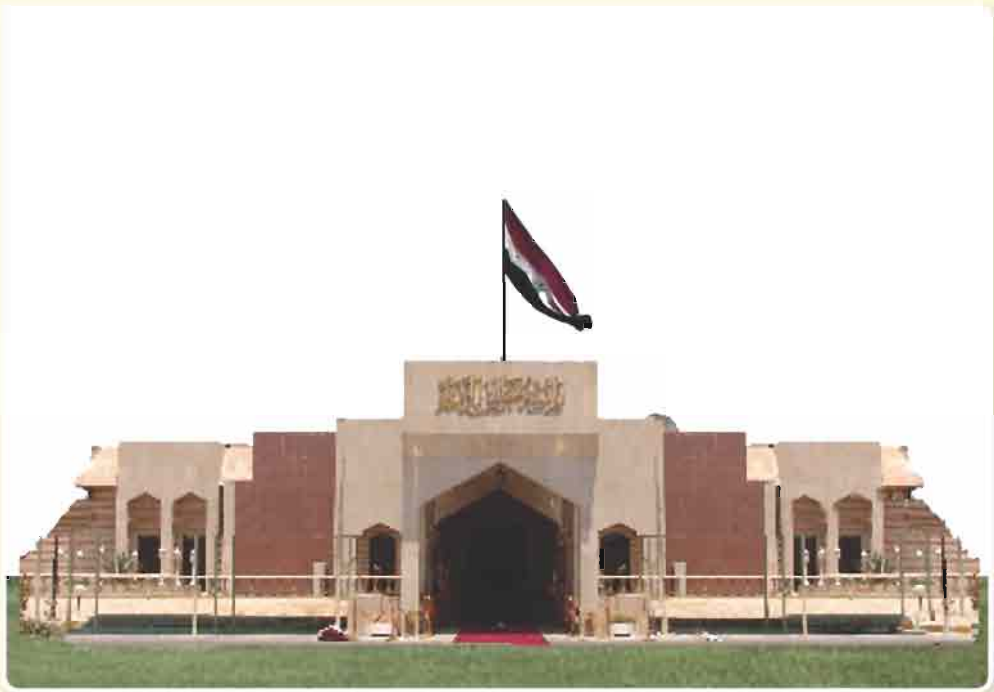
بناية مجلس الوزراء العراقي (مصدر السلطة التنفيذية)

تتكون السلطة التنفيذية من مجلس الوزراء (رئيس الوزراء والوزراء التنفيذيين). ويمارس مجلس الوزراء صلاحيات عديدة منها الاشراف على عمل الوزارات واقتراح مشروعات القوانين وتخطيط وتنفيذ السياسة العامة للدولة واعداد مشروع الموازنة العامة وغيرها من المهام كما يقوم رئيس الوزراء وهو المسؤول التنفيذي المباشر عن السياسة العامة للدولة بادارة المجلس وقيادة القوات المسلحة في حالات الحروب .