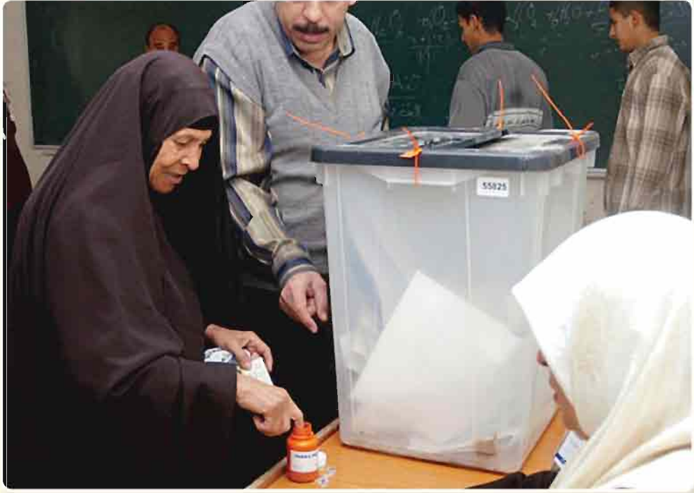
صورة لاحدى المراكز الانتخابية

كما اسلفنا سابقاً بان المجالس المحلية قد انبثقت عن مجالس المحافظات باعتبارها تمثل السلطة العليا في المحافظة والتي استمدت شرعيتها بانتخابات حرة ونزيهة. لذا فالمجالس المحلية تمثل تجربة ديمقراطية جديدة في بلادنا بعد زوال النظام السابق على الرغم من وجود جذور تاريخية لها في تراثنا العربي والاسلامي القديم. لذا نهضت تلك المجالس بدورها الريادي بالتنسيق مع السلطات المركزية للدولة في تنفيذ السياسات المحلية التي تحتاجها تلك المدن علماً بان حق الترشيح والانتخاب مكفول للجميع. ويعود سبب انبثاق هذه المجالس إلى التخلص من الجور والظلم والقرارات الفوقية التي لا تعبر للشعب - صاحب الشأن والمصلحة - اذناً صاغية ليقول كلمته فيما يطمح اليه ويريد تحقيقه.