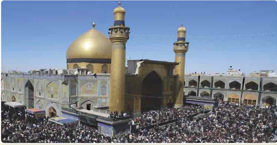
مرقد الامام علي (عليه السلام)

جاء في الدستور الفصل الثاني ، (عشر مواد) حددت بموجبها الحريات العامة للانسان العراقي وهي مصونة إذ لا يجوز توقيفه إلا بموجب أمر قضائي كما يحرم جميع أنواع التعذيب النفسي والجسدي والعمل القسري (السخرة) والعبودية . وتكفل الدولة حرية التعبير عن الرأي وحرية الصحافة والطباعة والاعلام والنشر وحرية الاجتماع والتظاهر السلمي . كذلك اكد الدستور حرية العبادة وحماية أماكنها وممارسة الشعائر الدينية .