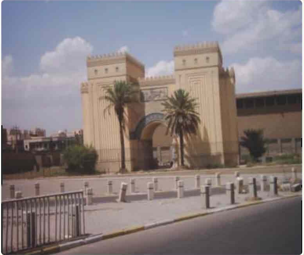
مبنى المتحف العراقي