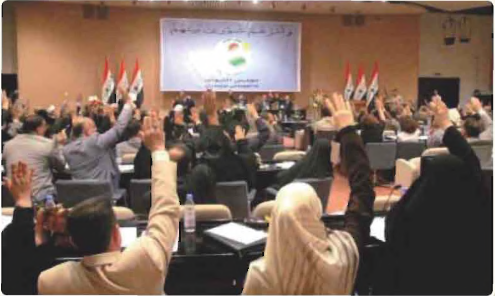
صورة لمجلس النواب العراقي (البرلمان)

ويختص مجلس النواب بتشريع القوانين والرقابة على اداء السلطة التنفيذية والمصادقة على المعاهدات والاتفاقيات الدولية وإقرار الموازنة العامة والموافقة على تعيين الاشخاص في المناصب العليا في الدولة وغيرها من المهام .