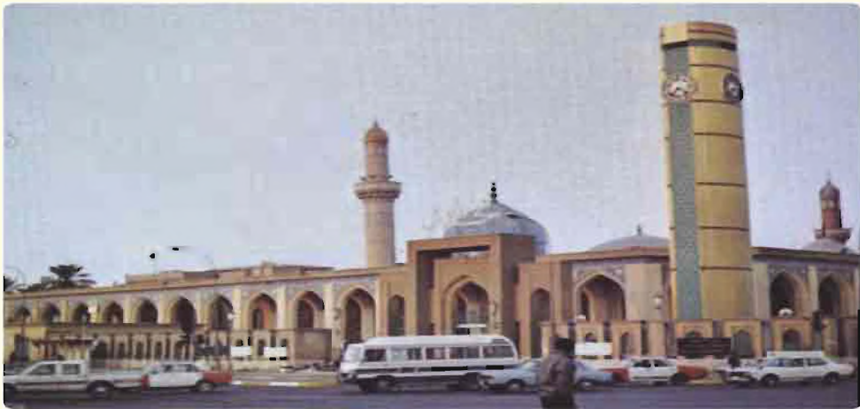
مرقد الامام الاعظم ابو حنيفة النعمان (رضي الله عنه)