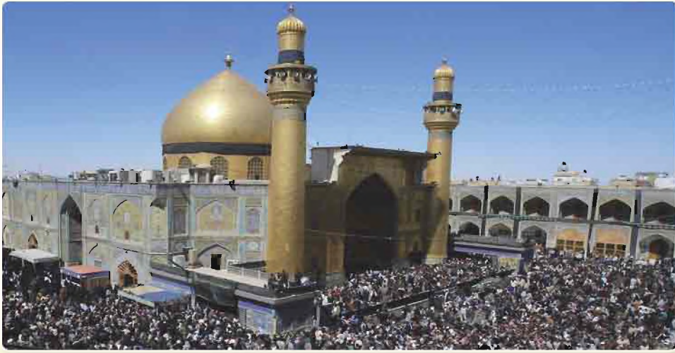
مرقد الامام علي (عليه السلام)

جاء في الدستور الفصل الثاني ، (عشر مواد) حددت بموجبها الحرية العامة للانسان العراقي وهي مصونة إذ لا يجوز توقيفه إلا بموجب أمر قضائي كما يحرم جميع أنواع التعذيب النفسي والجسدي والعمل القسري (السخرة) والعبودية . وتكفل الدولة حرية التعبير عن الرأي وحرية الصحافة والطباعة والاعلام والنشر وحرية الاجتماع والتظاهر السلمي . كذلك اكد الدستور حرية العبادة وحماية أماكنها وممارسة الشعائر الدينية .