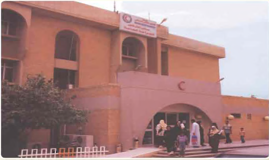
مستشفى الهلال الاحمر العراقي

اولاً : المنظمات الحكومية او الرسمية: تتولى الدولة فيها اقرار النظام الداخلي وطبيعة التمويل والاهداف التي تسعى الى تحقيقها وتكون إدارتها بالتعاون مع الهيئات والتنظيمات الرسمية ومن خلال الاعتماد على سياسة الدولة (الاجتماعية او الاقتصادية او السياسية) حيث تسعى الى النهوض بالمجتمع لتحقيق الضمان الاجتماعي والصحة والتعليم لجميع ابناء الشعب ومن هذه المنظمات (منظمة الهلال الأحمر العراقي ، اتحاد الصناعات العراقي ، المنظمة العراقية للتربية والثقافة والعلوم ، دور رعاية الايتام)