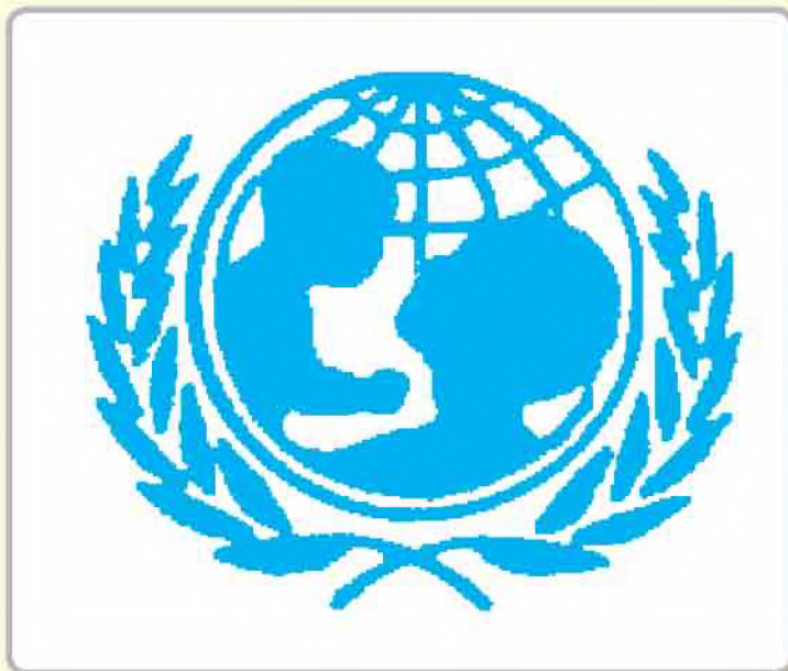
شعار منظمة اليونيسيف

كلمة (اليونيسيف) تتكون من الحروف الأولى لمنظمة الأمم المتحدة . وتنامت هذه الحركة مع تطور مفهوم حقوق الطفل وظهور مؤسسات تعبر عن هذه الحقوق .