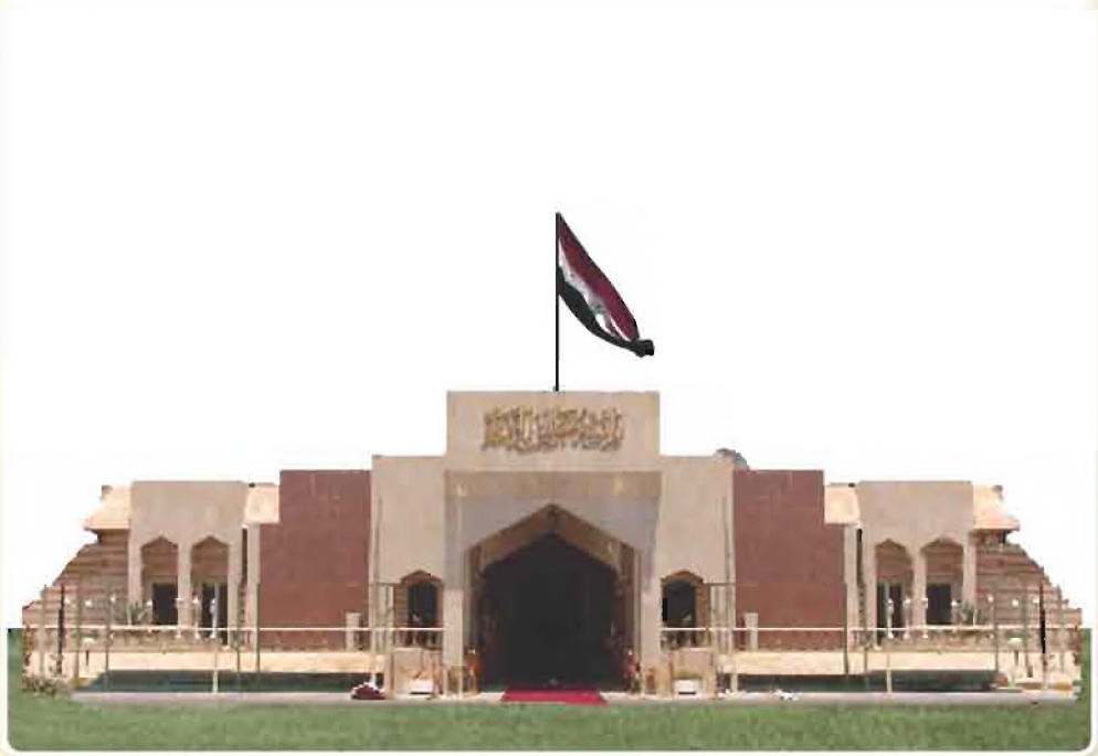
بنية مجلس الوزراء العراقي (مصدر السلطة التنفيذية)

تتكون السلطة التنفيذية من مجلس الوزراء (رئيس الوزراء والوزراء التنفيذيين). ويمارس مجلس الوزراء صلاحيات عديدة منها الاشراف على عمل الوزارات واقتراح مشروعات القوانين وتخطيط وتنفيذ السياسة العامة للدولة واعداد مشروع الموازنة العامة وغيرها من المهام كما يقوم رئيس الوزراء وهو المسؤول التنفيذي المباشر عن السياسة العامة للدولة بادارة المجلس وقيادة القوات المسلحة في حالات الحروب .