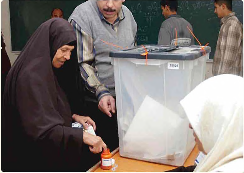
صورة لاحدى المراكز الانتخابية

كما اسلفنا سابقاً بان المجالس المحلية قد انبثقت عن مجالس المحافظات باعتبارها تمثل السلطة العليا في المحافظة والتي استمدت شرعيتها بانتخابات حرة ونزيهة. لذا فالمجالس المحلية تمثل تجربة ديمقراطية جديدة في بلادنا بعد زوال النظام السابق على الرغم من وجود جذور تاريخية لها في تراثنا العربي والاسلامي القديم. لذا نهضت تلك المجالس بدورها الريادي بالتنسيق مع السلطات المركزية للدولة في تنفيذ السياسات المحلية التي تحتاجها تلك المدن علماً بان حق الترشيح والانتخاب مكفول للجميع. ويعود سبب انبثاق هذه المجالس إلى التخلص من الجور والظلم والقرارات الفوقية التي لا تعبر للشعب - صاحب الشأن والمصلحة - اذناً صاغية ليقول كلمته فيما يطمح اليه ويريد تحقيقه.