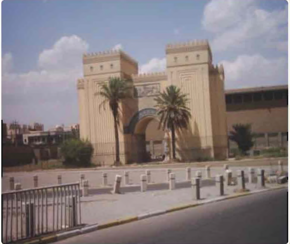
مبنى المتحف العراقي