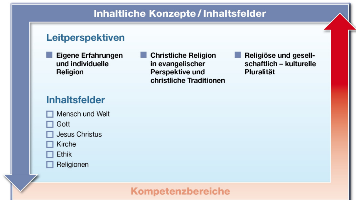
Abb. 2: Leitperspektiven und Inhaltsfelder im Fach Evangelische Religion

Für das Fach Evangelische Religion sind drei Leitperspektiven grundlegend, die abbilden, wie uns Religion in der Lebenswirklichkeit begegnet: