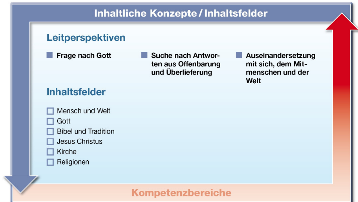
Abb. 2: Leitperspektiven und Inhaltsfelder im Fach Katholische Religion

Christlicher Glaube erschließt sich den Lernenden in Auseinandersetzung mit eigenen Erfahrungen und Überzeugungen sowie mit den Erfahrungen und Überzeugungen anderer. Dazu sind die Perspektive anderer Konfessionen, Religionen und Weltanschauungen, die Perspektive anderer Fächer und Wissenschaften sowie die Perspektive von Kunst, Kultur und Medien bedeutsam. Diese dialogische Erschließung erfordert von allen Beteiligten die „Bereitschaft und Fähigkeit, die eigene Perspektive als begrenzte zu erkennen, aus der Perspektive anderer sehen zu lernen und neue Perspektiven dazuzugewinnen“. 7